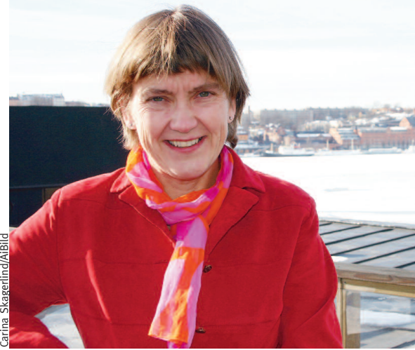
Lena Sommestad, tidigare miljöminister.