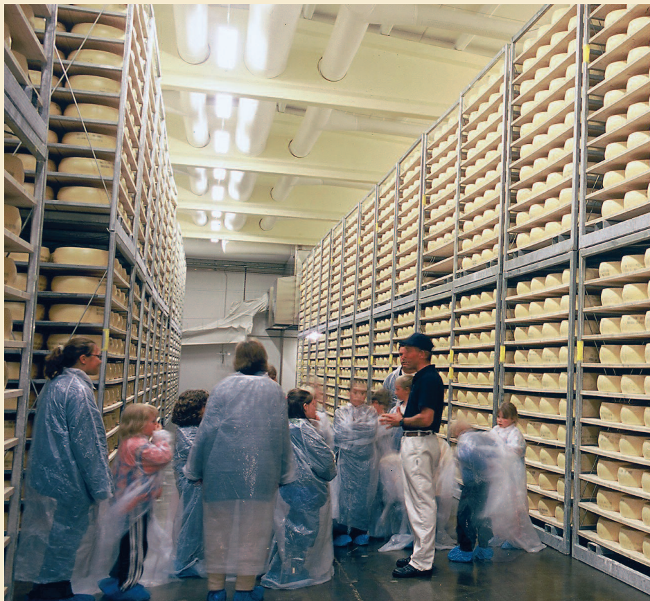
Här lagras ost i västerbottniska Ånäs – med ekonomiskt stöd från EUs regionala fonder.

Kommuner och landsting påverkas allt mer av EU-samarbetet. EU griper in i deras uppgifter på ett drygt tiotal samarbetsområden, bland annat genom effekter av den inre marknaden, miljösamarbetet, sammanhållningspolitiken (EUs strukturfonder och stödprogram) och socialpolitiken.