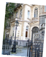
Europaparlamentet: Sysselsättnings- utskottet