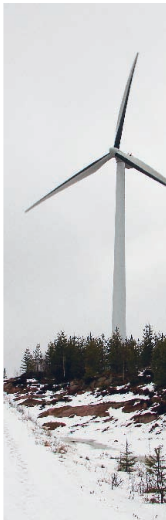
Vindkraftverket Freja med rotorerna långa vingar, Hunflens topp i Äppelbo.

Men ute i Europa fanns det en bank som ansåg sig kunna investera med sitt eget glesbygdskunnande som grund. Royal Bank of Scotland var med när fjärrvärmeverket drog igång 1999. Sen dess har fjärrvärmeverket utvecklats att eldas med flis från all sly som finns och alla möjliga andra biobränslemöjligheter prövas. Procordias livsmedelstillverkning, bland annat deras djupfrysta pizzor, lämnar en del spill som med fördel kan användas. Det är en fullt möjlig tanke att pizzaresster värmer och ger kraft till Vansbroborna i framtiden.