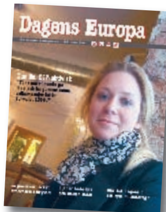
Dagens Europa nr 1 gavs ut i mars 2007.