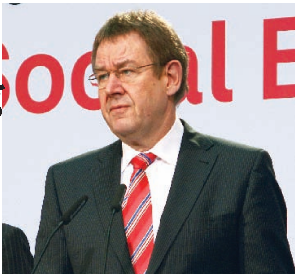
Poul Nyrup Rasmussen är ordförande i ESP, som erbjuder sina medlemmar att vara med om att utforma politiken inför nästa års EU-val. Här talar han på EUs toppmöte i Berlin mars 2007 när EU firade 50 år.

Där kan man registrera sig som ESP-aktivist, enda villkoret är att man redan är medlem i något av ESPs medlemspartier inom EU. Men man kan nöja sig med att delta som "gäst" och då krävs förstås inte att man är partiorganiserad.