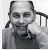
Stuart Hall.

Postkoloniala teoretiker började laborera med begreppet kreolisering i och med avkolonialiseringen och uppkomsten av nationella