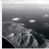
Santa Luzia, en av Kap Verdes öar.

I och med den transatlantiska slavhandeln blev Kap Verde snart ett handelscentrum för