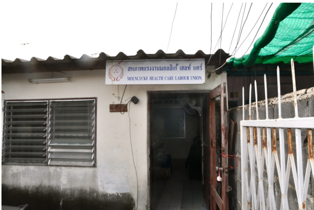
Fackklubbens lokaler några kilometer från fabriken.