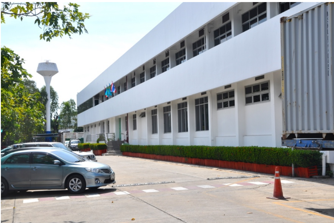
Mölnlyckes fabrik 1 i Bangphi Industrial Estate.

Mölnlycke saknar europeiskt företagsråd (EWC). Företaget har inte heller slutit något globalt ramavtal, däremot har man antagit en uppförandekod. 10