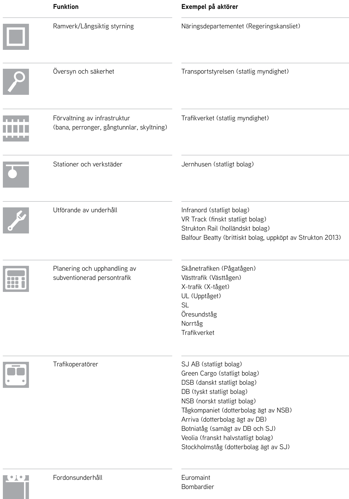
Figur 2. Avregleringen har lett till att ett stort antal aktörer i dag är verksamma inom den svenska järnvägssektorn. Schematiskt kan järnvägens huvudaktörer beskrivas på detta vis: