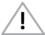
Figur 5. Exempel på allvarliga olyckor