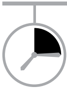
Figur 4. Vad beror förseningarna på?